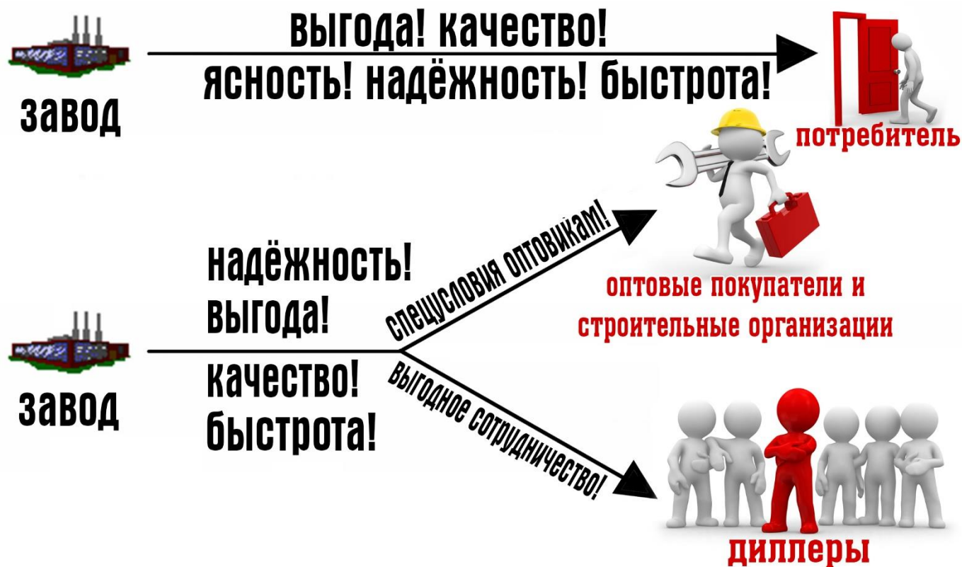
Схема заказа непосредственно «ЗАВОД-ПОТРЕБИТЕЛЬ», в свою очередь, даёт нашим покупателям

весомое преимущество в плане экономии денежных средств, путём исключения из цепи товарооборота множества нежелательных для потребителя посредников.